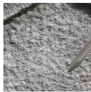
Afwerking met puntijzer