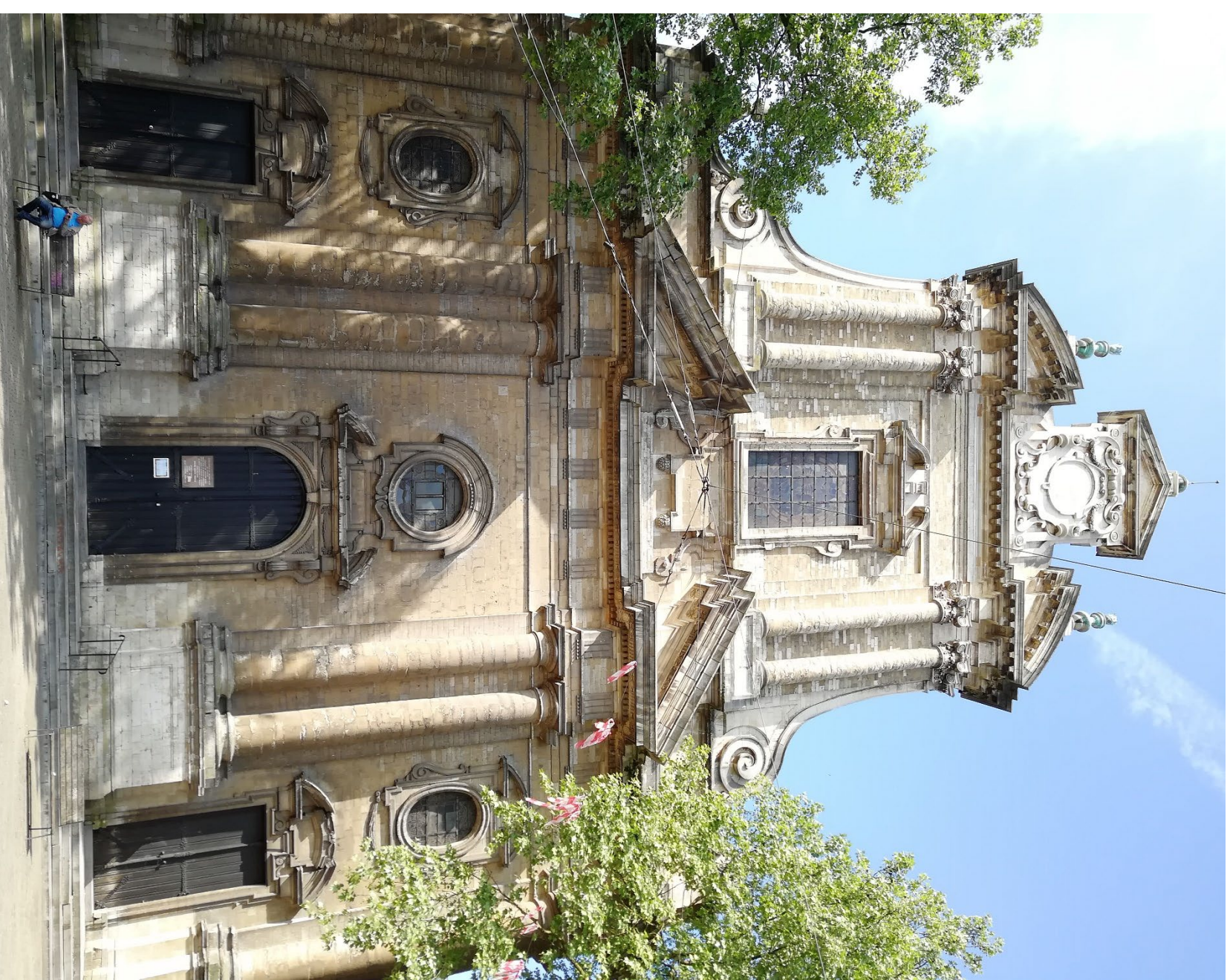
Façade de l'église de la Trinité, Ixelles, à l'origine façade de l'église des Augustins / Gevel van de kerk van de Heilige Drievuldigheid, Elsene, oorspronkelijk de voorgevel van de Augustijnerkerkarch. Jacques Francquart, 1621-1642