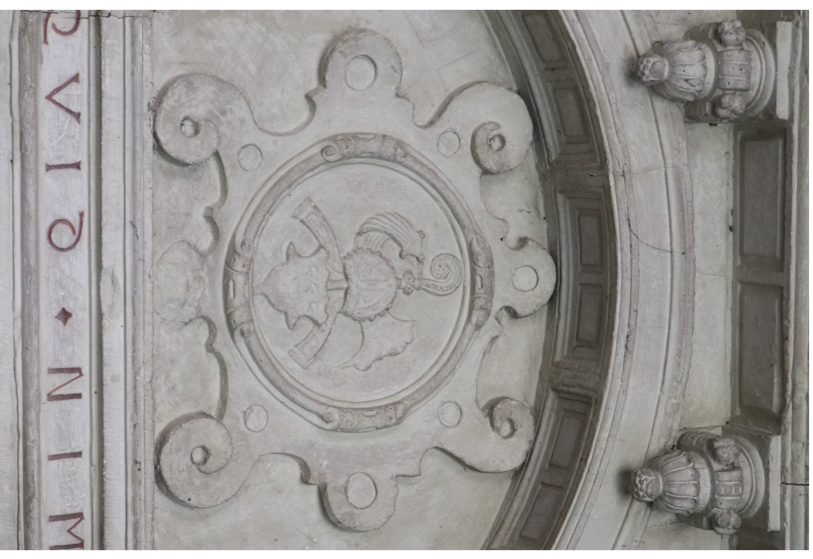
Motif en cuir découpé, tympan du portail de l'aile orientale du cloître de l'abbaye du Parc, Leuven / Rolwerk, tympan boven de deur van de oostelijke vleugel van de Parkabdij te Leuven, 1562.