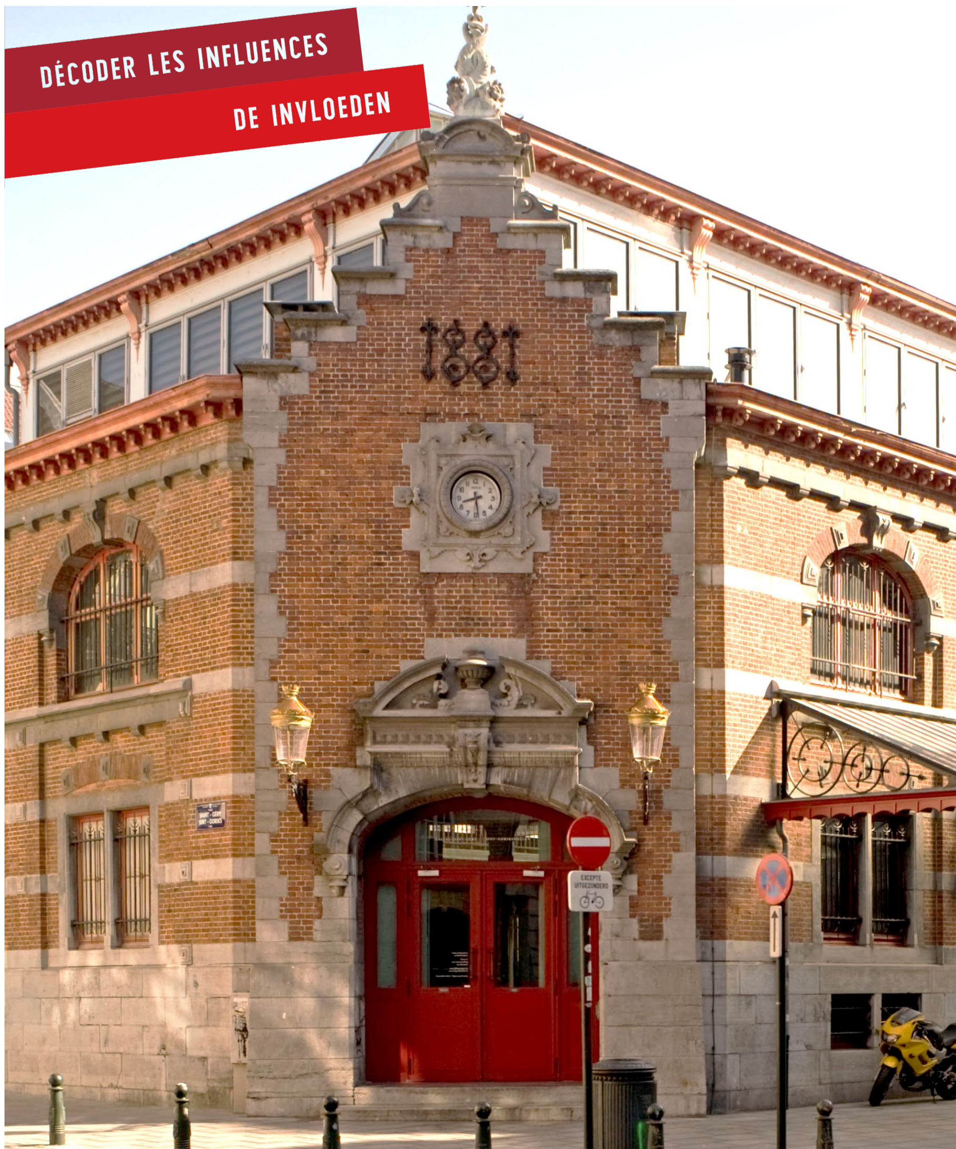
Halles Saint-Géry/Sint-Gorikshallen - Marché couvert/overdekte markt - arch. Adolphe Vanderheggen, 1881.