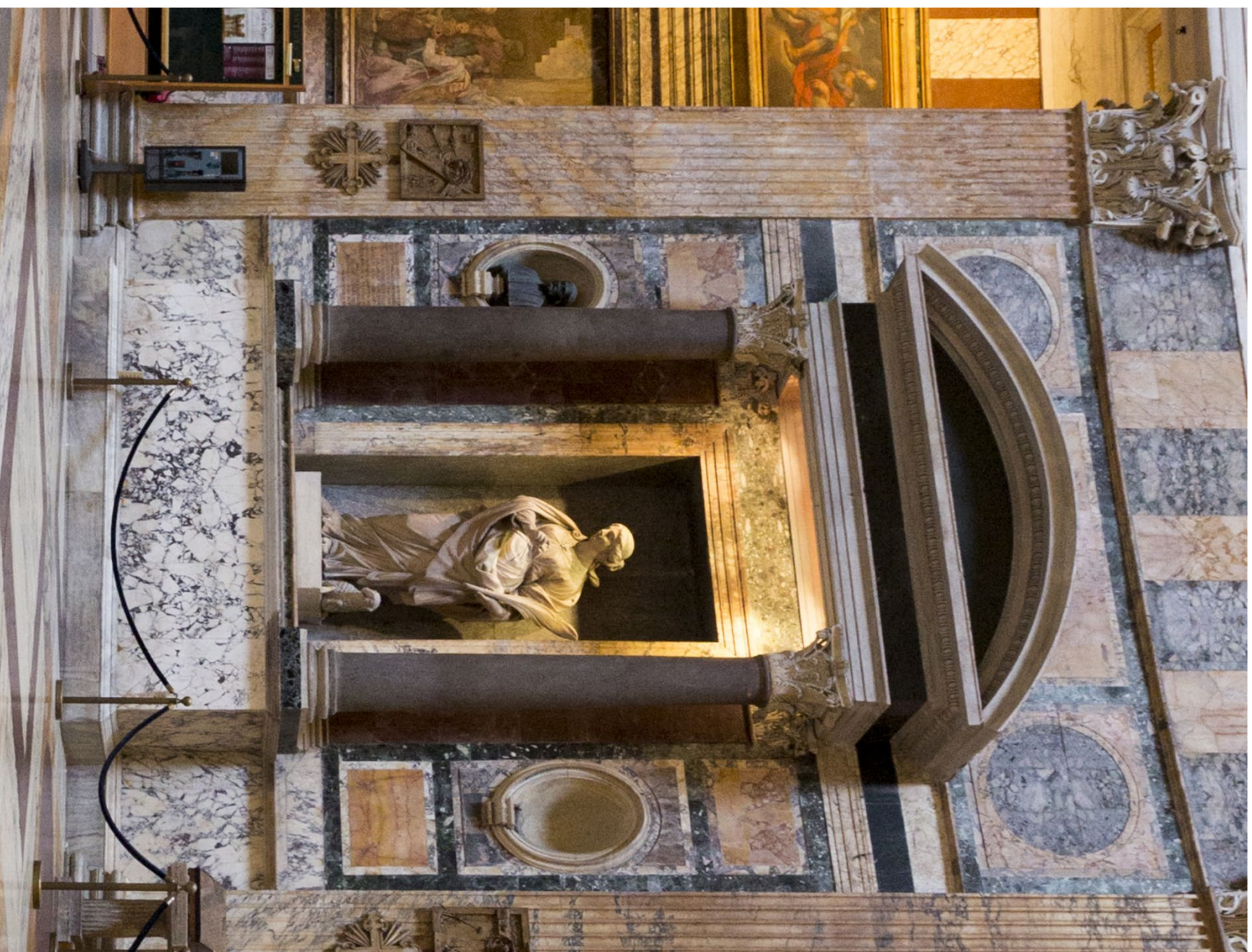
Intérieur du Panthéon, Rome, 125 av. J.C. / Interieur van het Pantheon, Rome, 125 v.C.