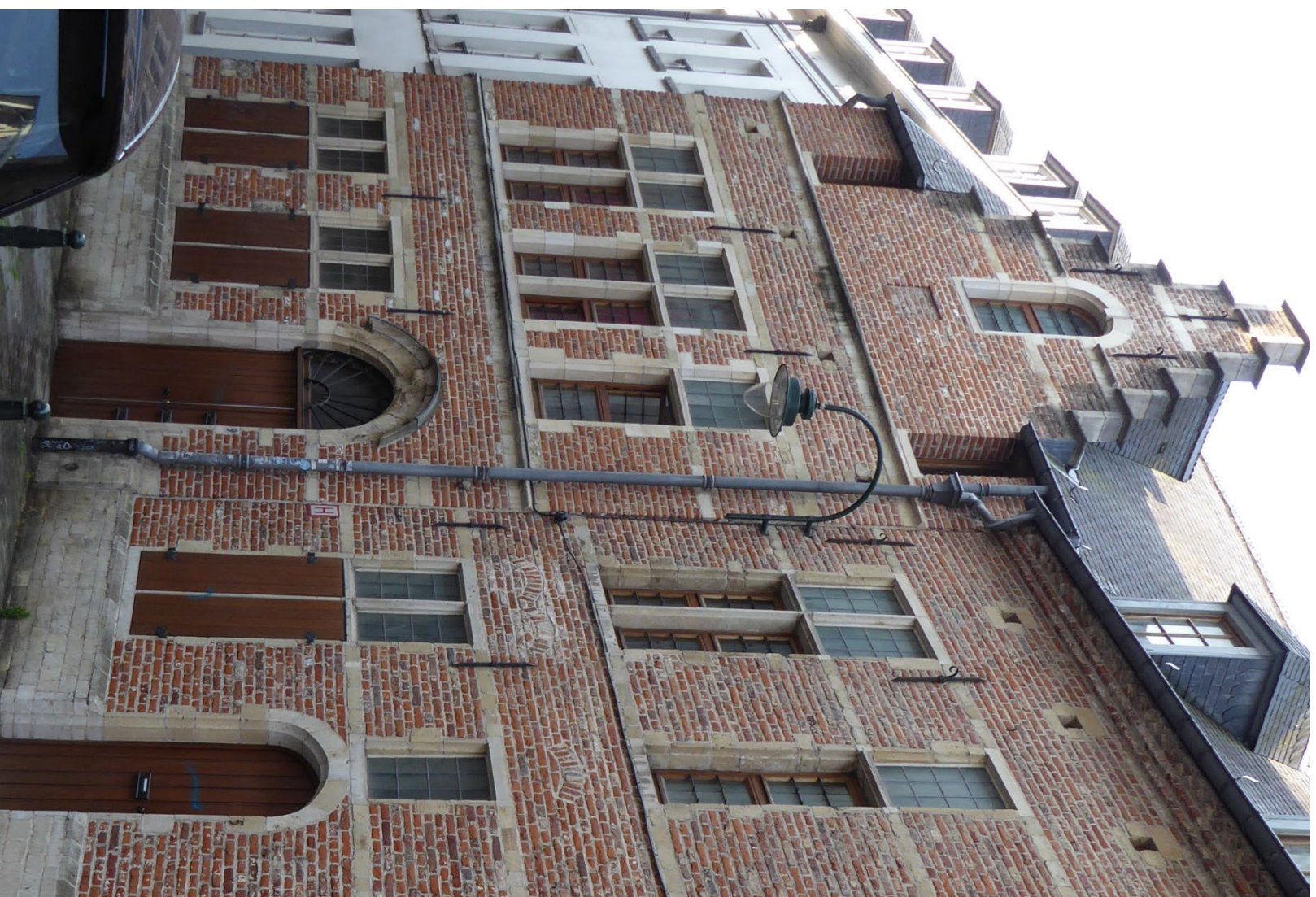
Maison rue de la Grande Île 5-9, Bruxelles, 17 e siècle (modifié au 19 e siècle) / Huis, Groot Eiland 5-9, Brussel, 17 de eeuw (aangepast in de 19 de eeuw)