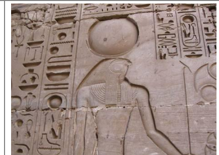
een verdiefte reliëf