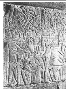
een bas-reliëf (laag reliëf)