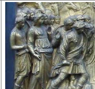
een haut-reliëf (hoog reliëf)