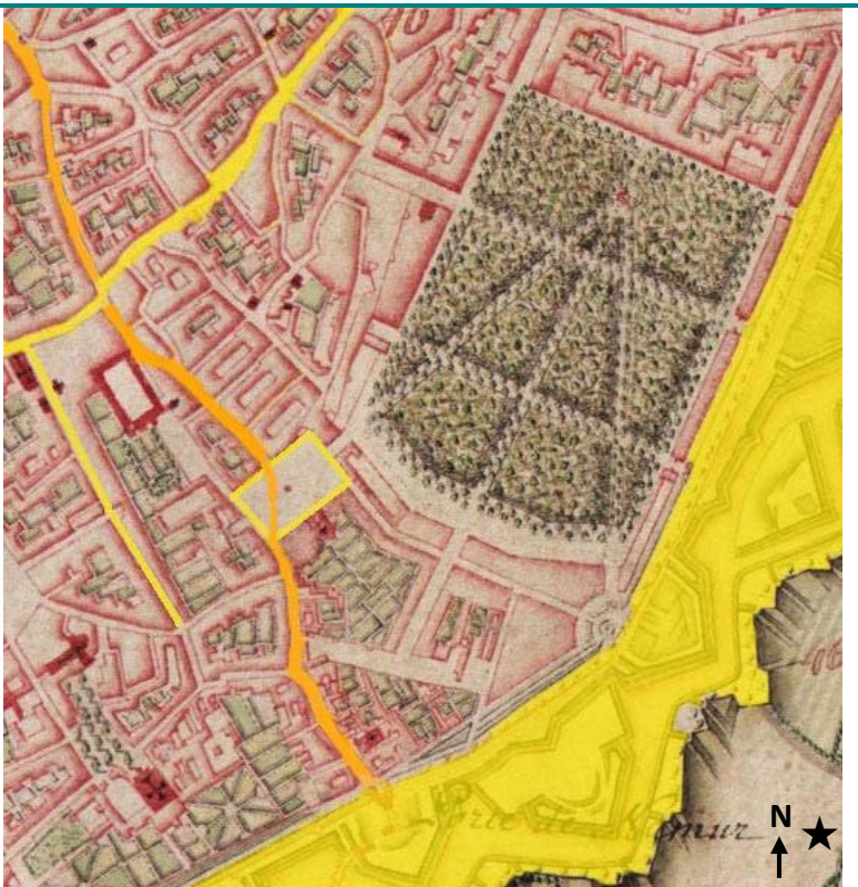
J.J.F. de Ferraris, Kaart van de Oostenrijkse Nederlanden (detail), 1777.

De eerste omwalling is verdwenen. De tweede omwalling is versterkt met driehoekige bastions.