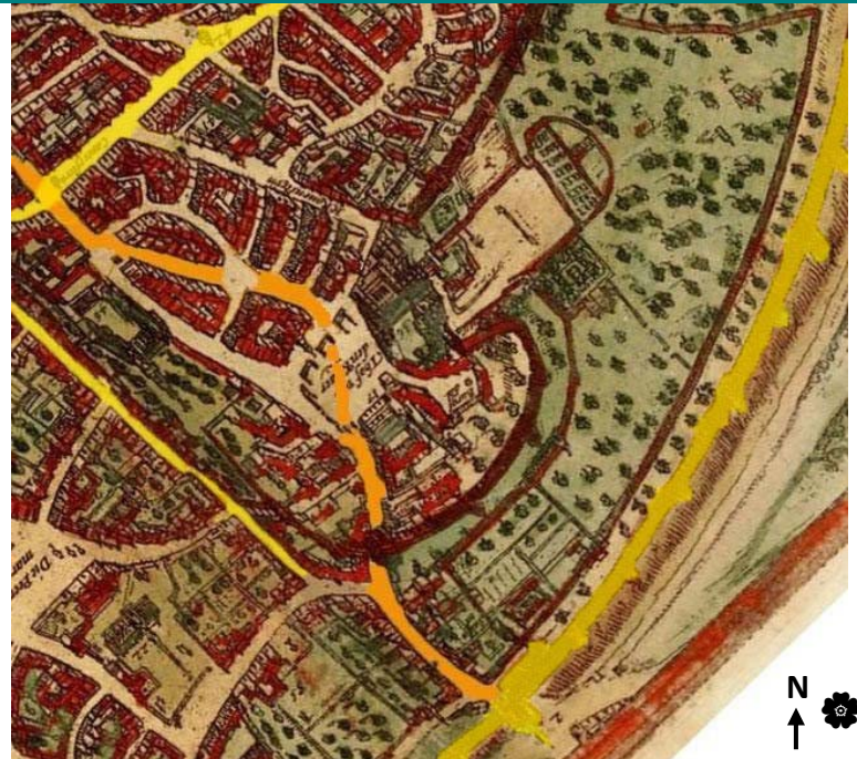
G. Braun et Fr. Hogenberg, Plan van Brussel (detail), 1572

→ Het Koningsplein zien we niet op de kaart, omdat het nog niet bestaat.